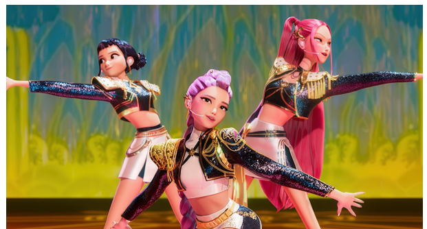
Các nhân vật trong trang phục biểu diễn

Không chỉ có tạo hình nhân vật với hình dáng, khuôn mặt, đôi chân dài miên man được cường điệu thêm mà trong phần hoạt hình, chuyển động, diễn hoạt của nhân vật cũng lấy cảm hứng từ manga (truyện tranh Nhật Bản) và anime . Trong hoạt hình 3D của Mỹ, điển hình là hai studio Walt Disney và Pixar, vẫn tuân thủ nguyên tắc hoàn hảo nghiêm ngặt, cách tạo hình và biểu cảm của nhân vật nữ chính thường có nhiều hạn chế hơn các nhân vật khác. Khi làm chuyển động, diễn xuất cho nhân vật nữ chính vẫn phải giữ cho họ xinh đẹp, nhất là đối với các nhân vật nữ anh hùng. Trái lại, anime vô cùng thoải mái, tự do trong việc bóp hình cường điệu, sẵn sàng làm xấu tạo hình nhân vật