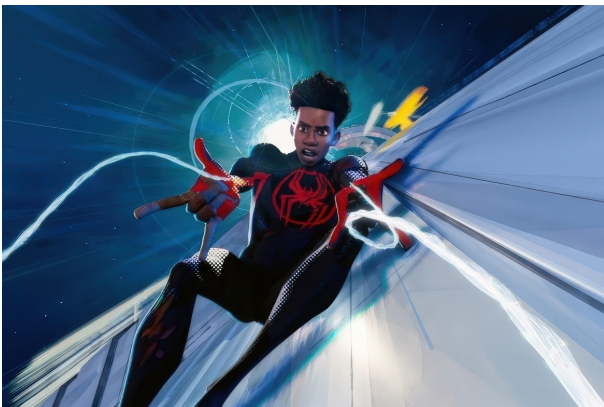
Hình ảnh trong phim Người nhện: Vượt ra ngoài vũ trụ nhện đang được Sony Pictures Animation sản xuất

Tuy nhiên, các nhà làm phim Thợ săn quý K-Pop lại muốn tránh xa phong cách này. Họ loại bỏ gần như mọi yếu tố 2D trong phim của mình. Rất ít những đường nét 2D vẫn được thể hiện trên nhân vật nói chung, trên gương mặt, biểu cảm của nhân vật nói riêng như trong loạt phim Vũ trụ Người Nhện . Bộ phim lấy rất nhiều cảm hứng từ khuôn mặt và diện mạo của anime nhưng thực hiện phiên bản 3D của nó, “thảm mĩ 2D nhưng với ngôn ngữ ba chiều” như lời