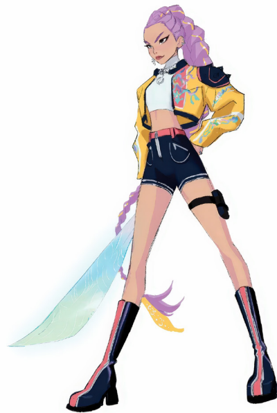
Phác thảo thiết kế 2D nhân vật, phim Thợ săn quý K-Pop của Helen Chen

Tạo hình và diễn xuất nhân vật trong phim cho thấy rõ sự kết hợp nhiều phong cách khác nhau giữa hoạt hình 3D với hoạt hình 2D, cụ thể là anime (tên gọi riêng cho hoạt hình Nhật Bản). Việc kết hợp hai thể loại này trong một bộ phim (còn gọi là hoạt hình lai) là phong cách hình ảnh sáng tạo, đột phá, nổi tiếng của Sony Pictures Animation trong nhiều năm gần đây,