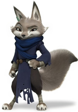
Nhân vật Zhen

phức tạp, có nhiều ẩn số, nhiều mâu thuẫn, thì thiết kế của Zhen lại khá an toàn và có phần lạc lõng nếu đứng cạnh các nhân vật khác. Các nhân vật trong Kung Fu Panda với ngôn ngữ tạo hình cá tính, khúc triết, cách điệu nhiều và giàu tính trang trí với những hoạ tiết, mảng màu trên cơ thể, nhiều phụ kiện trang trí, ngay cả Po với thiết kế tròn trịa, đơn giản thì việc sắp xếp mảng màu đen trắng cân đối, đối xứng cùng chiếc quần