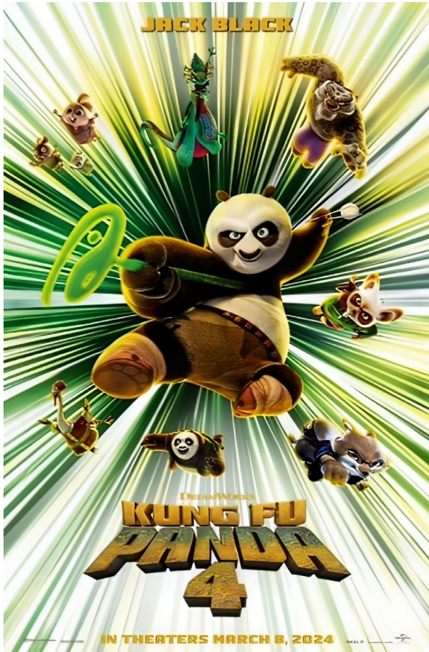
Poster phim Kung Fu Panda 4 .