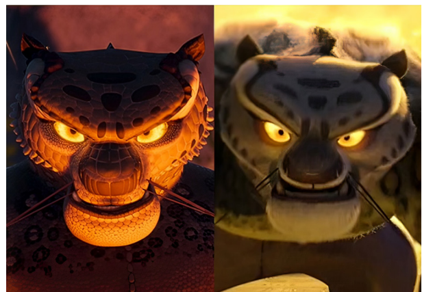
Trái: Tai Lung do Chameleon biến thành Phải: Tai Lung

Sự nhất quán còn thể hiện ở việc duy trì chi tiết giống nhau trong tạo hình các nhân vật mà Chameleon biến thành: trên cơ thể của họ đều có những dấu vết của tắc kè hoa như lớp da, vảy sần sùi, những cái gai nhọn tua tủa trên cơ thể thay cho lớp lông thú mềm mịn, ánh mắt thay đổi, móng vuốt và đồng tử cũng thay đổi giống cấu tạo mắt của loài tắc kè hoa, mang dấu ấn của Chameleon, phân biệt với phiên bản gốc.