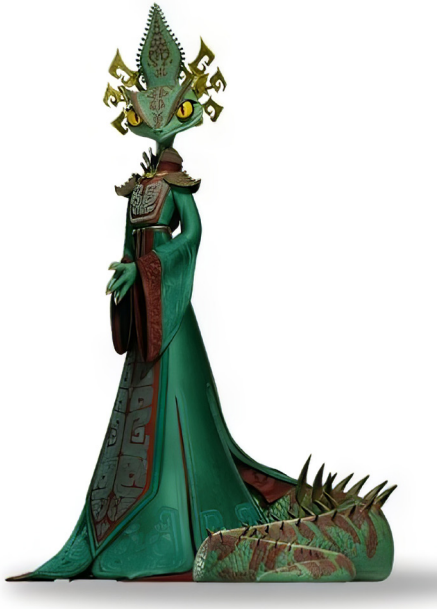
Nhân vật Chameleon

được cất giấu trong linh hồn. Vì thế Chameleon cần phải có được quyền trọng trí tuệ của Po để mở cánh cổng của linh giới, chiếm đoạn Kung Fu từ linh hồn của những bậc thầy ở đó.